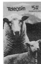
Schafe ... überall

Danke !!! Danke !!! Danke !!! Danke !!! Danke !!!